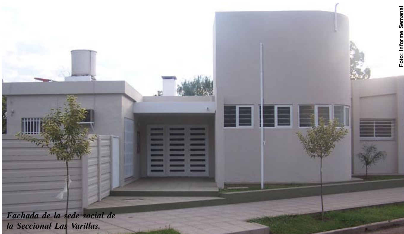
Fachada de la sede social de la Seccional Las Varillas.