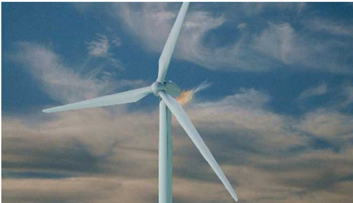
Las aspas del Eolis-15, que tiene una potencia de 1,5 megavatios

tencia que 500 megavatios eólicos instalados en esos lugares rendirían tanta electricidad anual como mil puestos en las zonas más ventosas de Alemania y Dinamarca.