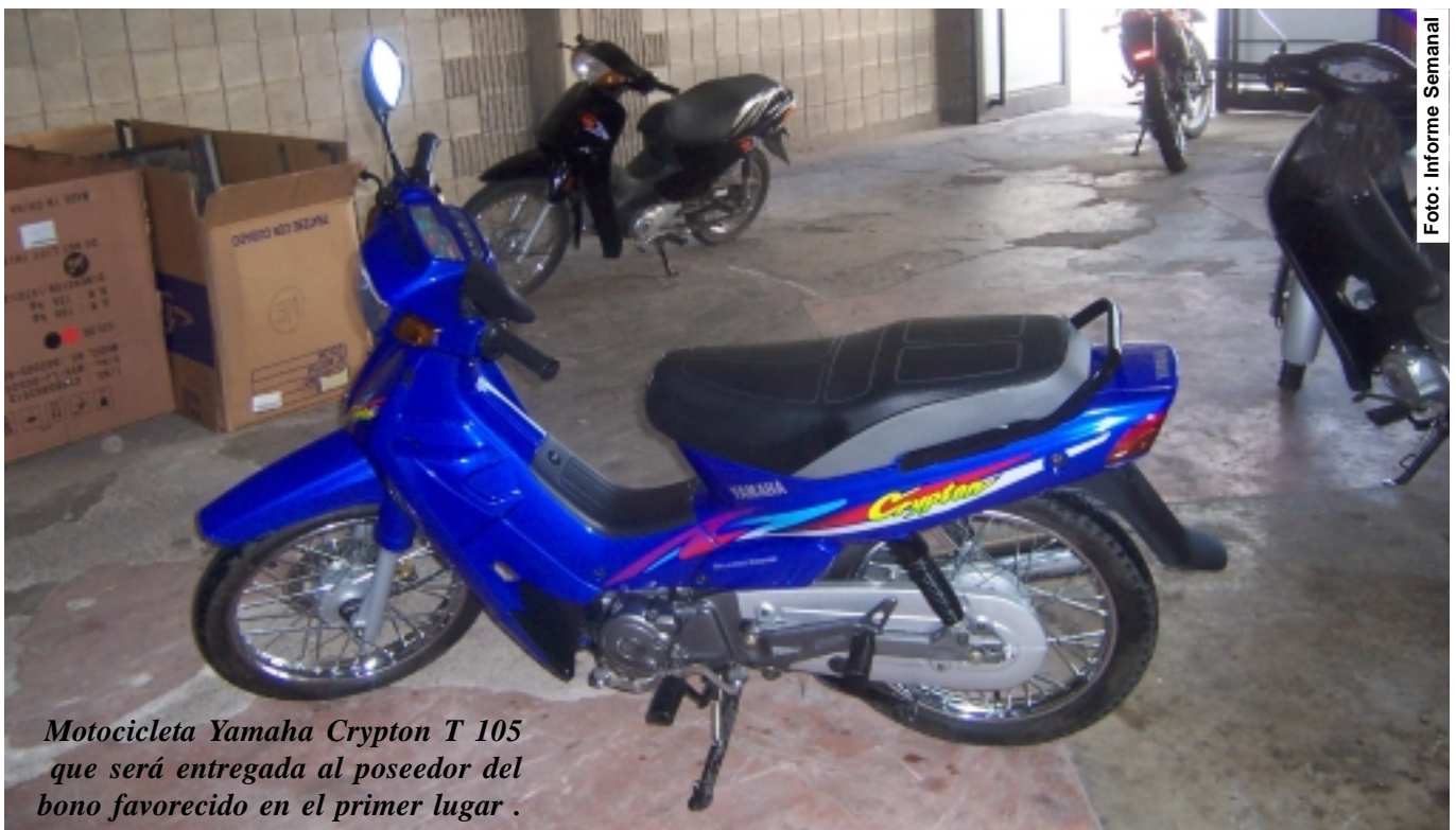
Motocicleta Yamaha Crypton T 105 que será entregada al poseedor del bono favorecido en el primer lugar .

organización, por lo cual apelamos al demostrado espíritu de colaboración de los compañeros afiliados, con el propósito de cumplir el objetivo señalado.