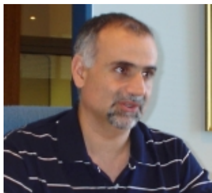
Cro. José Daniel Abdol Rahman, Subsecretario General.

Con esto queremos señalar que todo es un círculo en el cual cada cosa tiene su impacto, es decir, si aumenta la canasta familiar -cosa que ocurre de modo permanente y obscuro- los salarios se vuelven insuficientes para cubrir su costo; sin embargo los organismos reguladores y defensores de los intereses ciudadanos no anteponen ningún tipo de acción efectiva cuando los precios de los artículos de primera necesidad se disparan de forma inhumana, pero sí lo hacen, quizás por presión de la prensa u algún otro interés, cuando se trata de un incremento de tarifas en los servicios públicos, a pesar de que éstas sufren un atraso importante y los au-