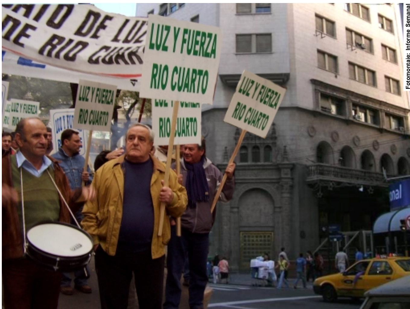
Fotomontaje: Informe Semanal

En ese sentido, tal lo expresado en un artículo publicado en nuestro Informe Semanal N° 684 (05/09/09), se hizo una presentación en los Tribunales de la ciudad de Córdoba para que se indague sobre esta anomalía que se llevó a adelante quién sabe por quién