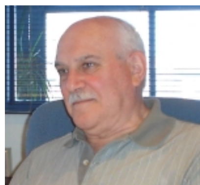
Cro. Julio César Zeballos, Secretario General.

La política es el arte de lo posible, permite con el paso del tiempo reinventarse y ser la figura excluyente del momento, que posee un abanico de proyectos y soluciones para todos los problemas, aunque antes haya cometido errores, delitos o traiciones, es así como el grupo Macri fue el causante de la debacle del Correo Argentino y hoy parece la solución del país, o el propio De Narváez, gran ganador de las últimas elecciones