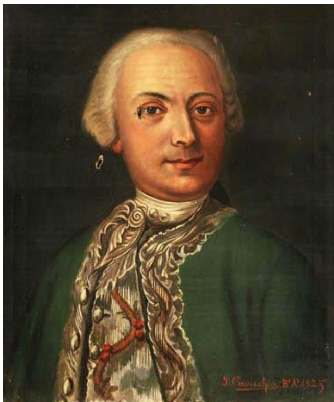
Virrey Pedro de Melo de Portugal y Villena.

Las guías turísticas capitalinas no incluyen este dato tan poco conocido como la accidentada muerte del virrey y su aún más curiosa exhumación. El dato de su entierro en Buenos Aires se rastrea en viejos repertorios y en las Memorias curiosas que suscribió Juan Manuel Berutti. Más recientemente figura en Buenos Aires, ciudad secreta, de Germinal Nogués, que señala a Melo como único gobernante de aquel entonces sepultado en Buenos