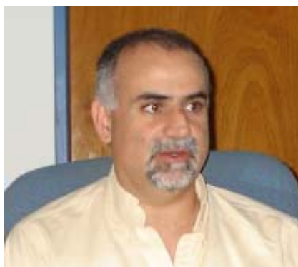
Cro. José Daniel Abdol Rahman, Subsecretario General.

Estas instituciones sin fines de lucro , junto a los trabajadores y nuestra organización sindical, fueron los encargados desde el principio de proveer del vital elemento para el crecimiento de los pueblos; el esfuerzo de los trabajadores, el importante aporte de Luz y Fuerza y la vocación de servicio de vecinos que integraban los consejos de administración de aquellas cooperativas, sin ningún otro interés que colaborar con la sociedad, hicieron crecer a estas instituciones, a tal