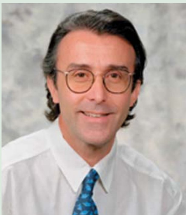
Dr. Julio Palmaz, creador del primer stent.

Como las tuberías de cualquier casa, las arterias que recorren el organismo humano también pueden obstruirse. Para destaparlas y darles un soporte continuo a sus paredes, se usa la técnica de la angioplastia con “stent”.