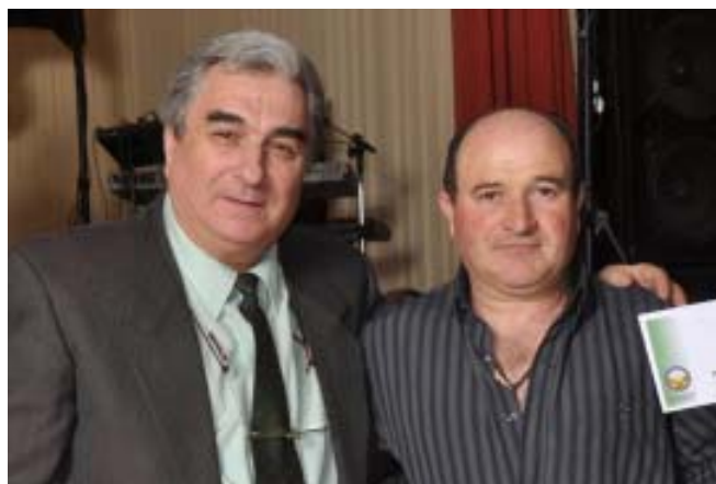
8° Horno microondas 30 lts. c/ grill "Moulinex" Eduardo Mazzone, Seccional Elena