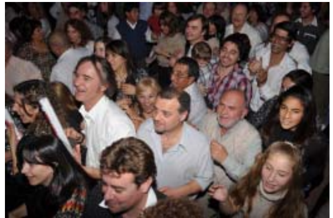
La diversión continuó hasta altas horas de la madrugada del domingo.

Con la animación musical del grupo local G-Latina, el cotillón y las ganas de divertirse que habitual-