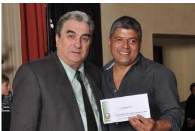
5° Estadía Colonia de vacaciones de Vª. del Dique Carlos Flores, Seccional Adelia María