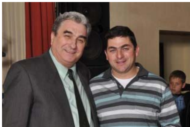
2° Heladera con freezer "Gafa" Carlos Schusselin, Seccional San Basilio